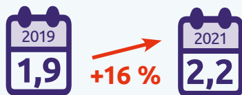
FIGURE 3. DURÉE DES SÉJOURS (JOURS)